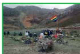
“Contribuyentes” - Cuenca alta -

Retribuyentes por el servicio ecosistémico: Es la persona que, obteniendo un beneficio económico, social o ambiental, retribuye a los contribuyentes por su labor en la conservación, recuperación y uso sostenible de las fuentes de los servicios ecosistémicos. Por ejemplo, los turistas que disfrutan de la belleza del paisaje de la cuenca o practican deportes de aventura, son potenciales retribuyentes.